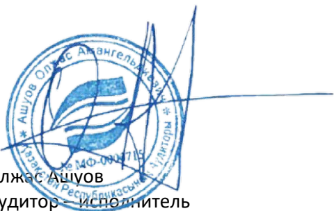
Олжас Ашұов Аудитор – исполнитель Квалификационное свидетельство № МФ-0000715 от 10 января 2019 г.

Мы осуществляем информационное взаимодействие с лицами, отвечающими за корпоративное управление, доводя до их сведения, помимо прочего, информацию о запланированном объеме и сроках аудита, а также о существенных замечаниях по результатам аудита, в том числе о значительных недостатках системы внутреннего контроля, которые мы выявляем в процессе аудита.