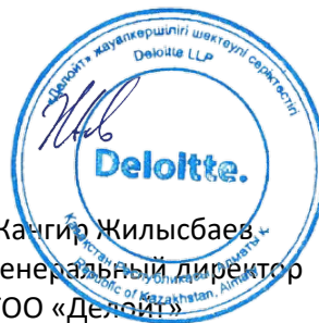
Жангир Жилисбаев Генеральный директор ТОО «Делойт»

Государственная лицензия на осуществление аудиторской деятельности в Республике Казахстан № 0000015, серия МФЮ-2, выданная Министерством финансов Республики Казахстан от 13 сентября 2006 г.